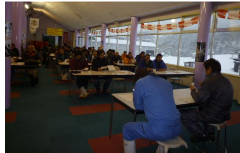
救命訓練（平成26年11月29日）

緊急時の対応訓練といたしまして、全従業員を対象に平成26年11月29日に南越消防組合の方を講師にお招きし救命講習会を実施いたしました。