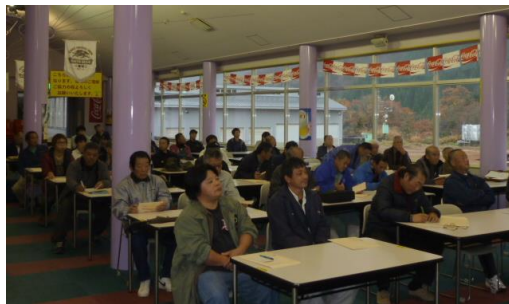
索道係員研修会（平成26年11月29日）

研修会につきましては、平成26年11月29日に実施し、「平成26年度索道技術管理者研修会テキスト」等より事故事例を参考になぜ事故が発生したのか、どうすれば事故を防げたのか等質疑応答形式で行い、索道係員としての安全意識の向上を目指し開催いたしました。